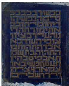
Dvora Barzilai, Hatikva (Die Hoffnung) , 2009

Downloads in Druckqualität: www.kunstraum-nestroyhof.at/presseservice